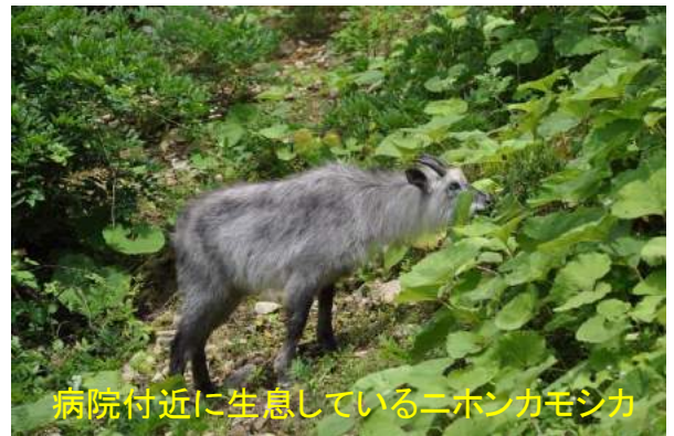
病院付近に生息しているニホンカモシカ

発行：栃木県医師会塩原温泉病院 〒329-2921 栃木県那須塩原市塩原1333 TEL:0287(32)4111 FAX:0287(32)4226 ホームページ：http://www.shiobara-hp.jp