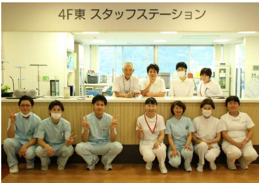
4F東 スタッフステーション

維持期は、終わりではなく始まりです。維持できるように、患者さんに励まし、意欲が出るようにチームで 関わっています。